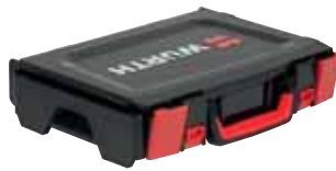
Fechos com cavidade