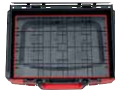
Parte interior uniforme