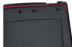
Vedação elastômera vermelha em toda a volta