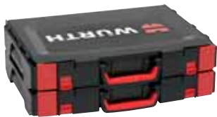
União de várias malas