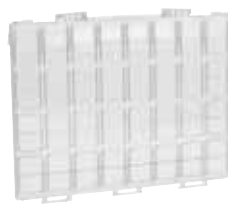
Estrutura em tampa transparente