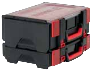
União de várias malas