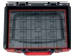
Parte interior uniforme