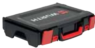
Fechos com cavidade