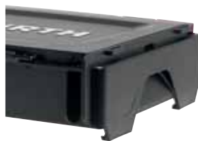
Quatro pés de apoio

A ferramenta ideal de organização para um armazenamento variável de materiais de consumo. A tampa transparente garante uma boa visibilidade.