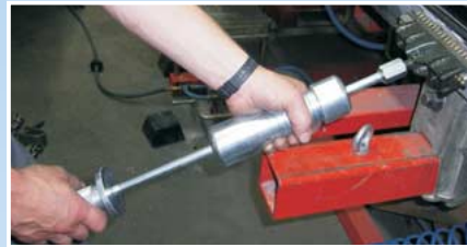
Kaportanın hızlı düzeltilmesi için düzeltme çekiçli düzeltme traversleri.