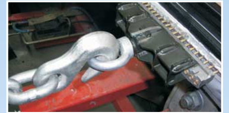
Çekme halkalı çekme traversi bir düzeltme tezgahının veya dozerin zincirine takılı.