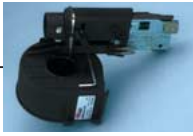
ASSYmat 50 0702 164 1