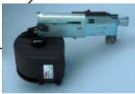
ASSYmat 80 0702 164 2