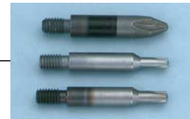
PZ2 0614 176 687 AW20 0614 622 0 AW25 0614 622 5