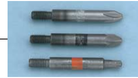
PH2 0614 176 679 PZ2 0614 176 677 AW20 0614 542 0