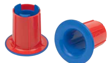
Gleithülsen Ergo für 430- und 500-mm-Folie.