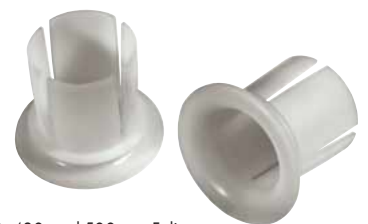
Griffhülsen für 430- und 500-mm-Folie.