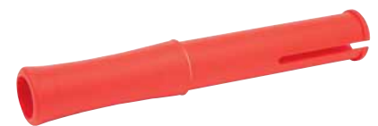
Griff für 100-mm-Folie.