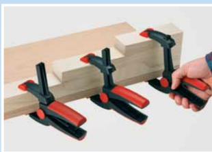
Einhandbedienung auch bei großen Spannweiten.