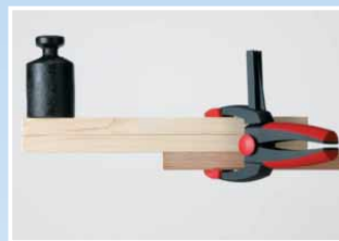
Maximale Spannkraft in jeder Stellung.