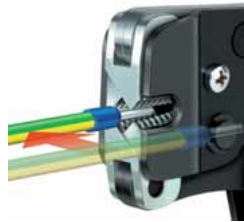
Seiteneinführung bis max. 2,5 mm 2 möglich