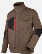
KASTANIEN- BRAUN M401276