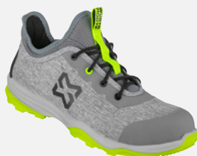
GRAU GELB M416173