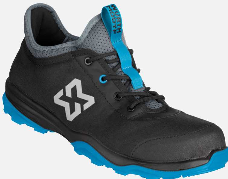
SCHWARZ BLAU M416172