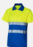
AMARILLO/A. REAL M409191