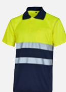
AMARILLO/A. MARINO M409190