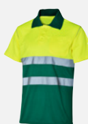
AMARILLO/ VERDE M409193