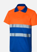
NARANJA/A. REAL M409195