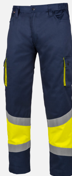
AMARILLO/A. MARINO M410066