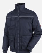
AZUL MARINO M411163