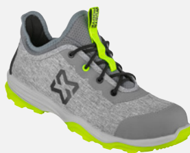
GRIS CLARO/AMARILLO M416173