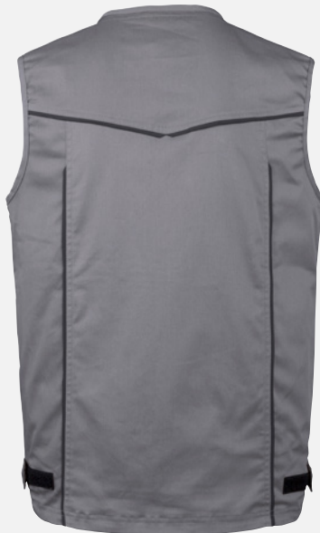
Vue du dos