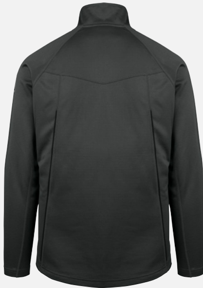
Vue du dos