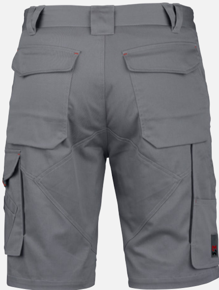
Vue du dos