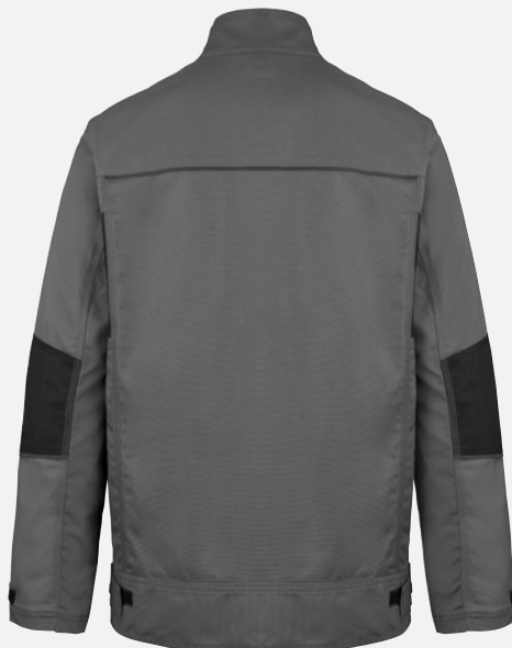
Vue du dos