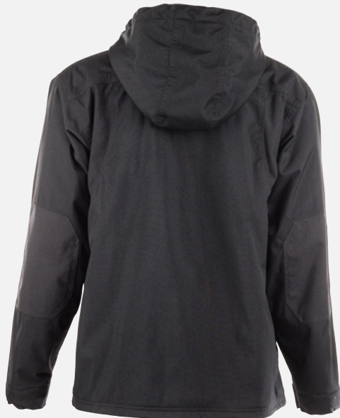
Vue du dos