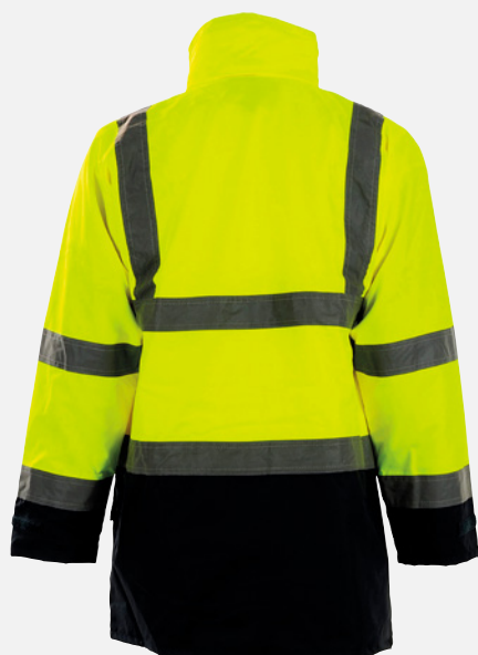
Vue du dos