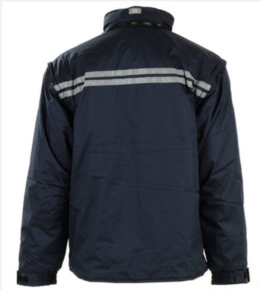
Vue du dos