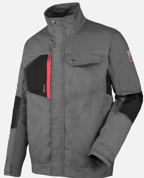
GRIGIO GRANITO M401274