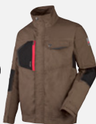
MARRONE CAS- TAGNA M401276