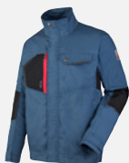
BLU ARDESIA M401275