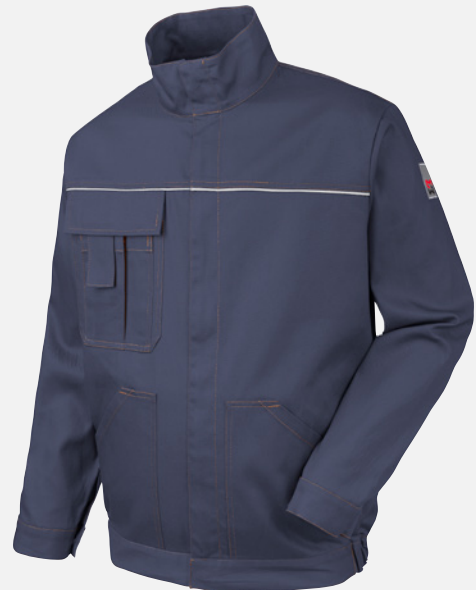
MARINE BLUE M001145