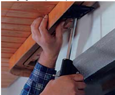
Befestigung von Gardinenleisten, Lampen usw.