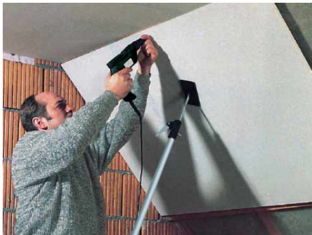
Befestigung von Gipskartonplatten.