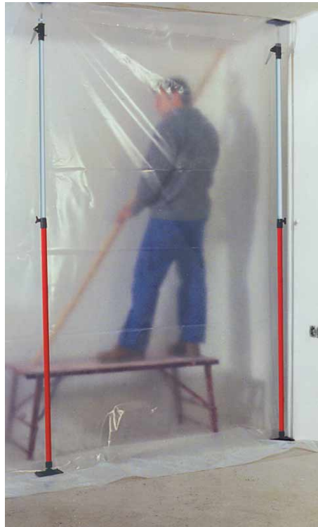
Erstellung einer Staubschutzwand.