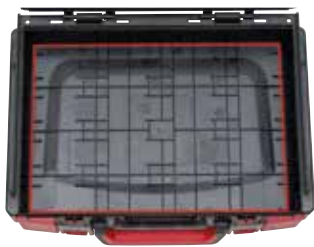
Viel Platz dank homogener Innenfläche