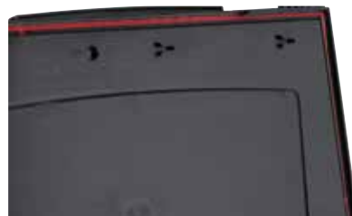
Umlaufende rote Elastomerdichtung