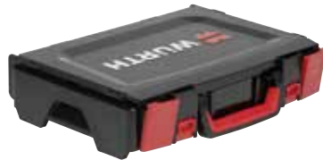
Verschlüsse mit Griffmulden