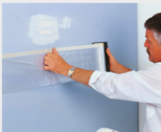
Fixieren und abrollen

Abrollen - Klebeband fixieren - abschneiden - Folie auseinanderfalten