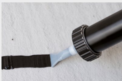
Beutelware mit praktischer Flächendüse

Zur Verklebung von Würth EPDM-Dichtbändern an Fenster- und Türailbungen sowie an sonstigen Bauuntergründen. Einsetzbar auch bei unebenen Laibungsuntergründen.