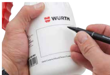
Individuell beschriftbares Etikett