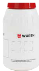
Extra Felder für Sicherheitshinweise

Spezielles Ansaugsystem ermöglicht eine 360°-Sprüfung und sorgt für zuverlässiges Arbeiten über Kopf, schräg oder vertikal.