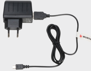
Netzteil mit USB-/Mini-USB-Anschluß