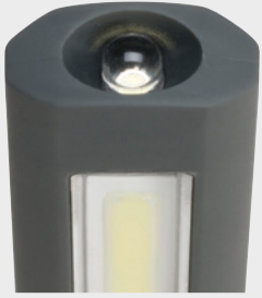
Taschenlampenfunktion, multifunktionell einsetzbar