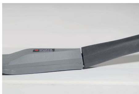
17° de inclinación.