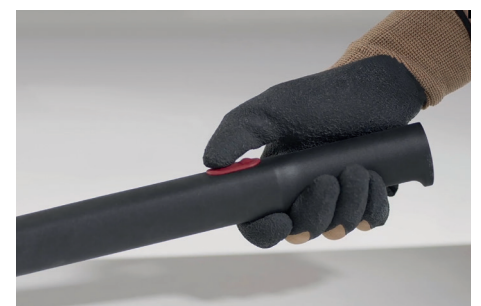
Pulsador de accionamiento.