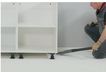
Comodidad de trabajo para el operario.

Este artículo no dispone de servicio de reparación Master Service