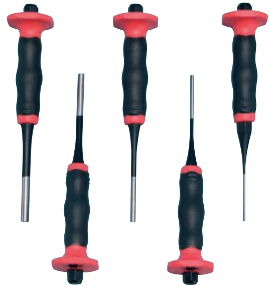
5-osainen sarja 0714 63 259 Sisältää koot 2, 3, 4, 5 ja 6mm