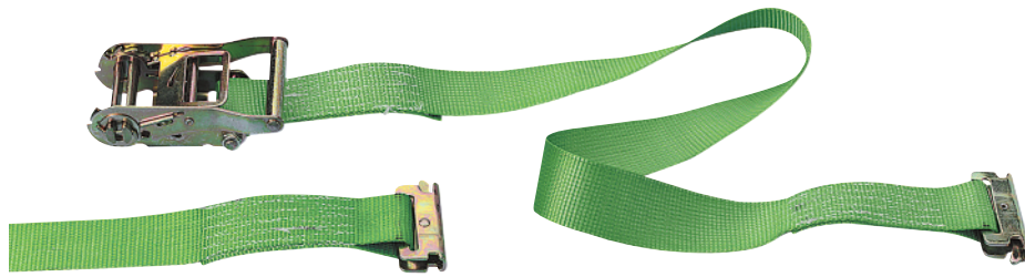
Sangle d'arrimage intérieur avec serrage à cliquet et terminaison droite (Art. N° 0713 93 4).

Arrimage de marchandise sur rail en remorques à structures fermées.