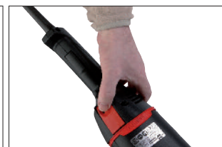
Rotation de la poignée à 180° facilitant l'utilisation dans différentes positions de travail.