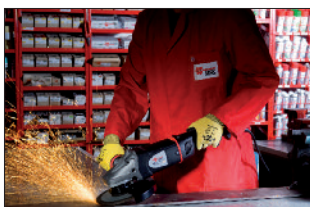
Meulage facile et précis grâce à la tête ultra plate de la machine.