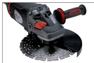
Poignée latérale réduisant considérablement les vibrations.