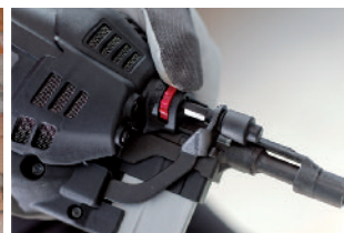
Molette de réglage pour la profondeur de pénétration de la pointe.