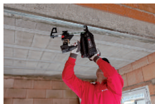
Clouage de rail au plafond.