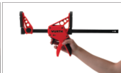
Ecarter et desserrer.