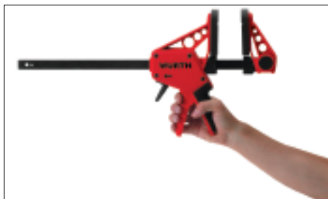
Serrer et desserrer.