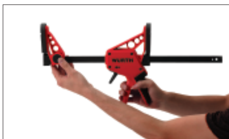
Puis la mettre de l'autre côté et remettre l'écrou.