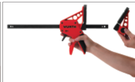
Enlever l'écrou et décrocher la mâchoire fixe.