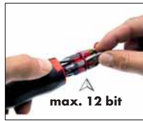
A kiválasztott bit könnyen kivehető.