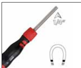
Mágneses 1/4"-os befogó.