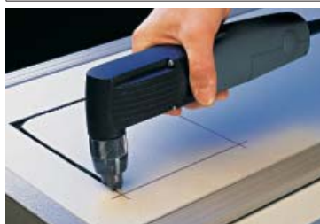
Szűk íveken is kitűnően használható