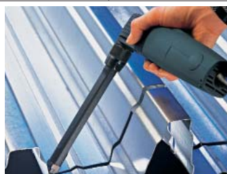
A hosszabbítóval a 160 mm mélységű profilok vágása is lehetséges.

A gép egy hosszabbító segítségével (kiegészítő alkatrész) átalakítható, így sík felületektől kezdve egészen mély profilok (pl. trapéz-lemezek, lásd lenti ábra) vágására, továbbá különösen kis körívű felületekre alkalmazható. Ezáltal széleskörű felhasználásra ad lehetőséget, a lemezmegmunkálás területén.