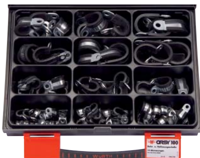
Cikkszám: 0964 542 73 db