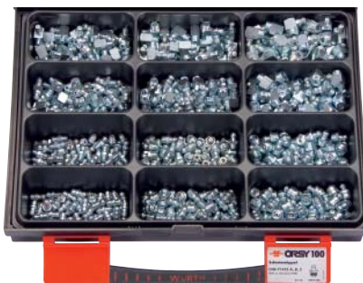
Cikkszám: 0964 986 600 db