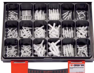
Cikkszám: 0964 500 250 150 db