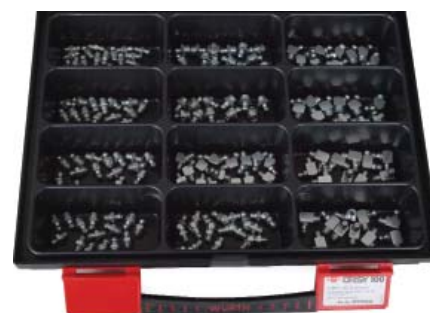
Cikkszám: 0964 986 02 160 db