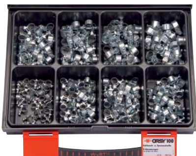
Cikkszám: 0964 540 200 db