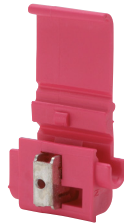
Solo a fini illustrativi