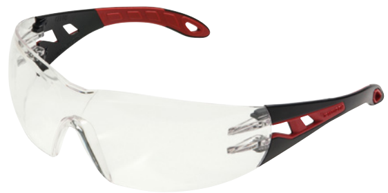
Solo a fini illustrativi

Massimo comfort e buona aderenza grazie alle stanghette flessibili a due componenti