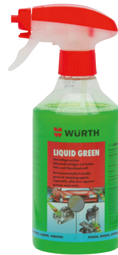
Solo a fini illustrativi