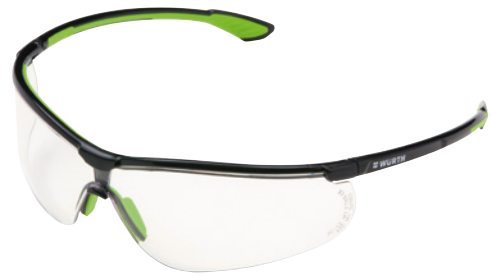
Solo a fini illustrativi