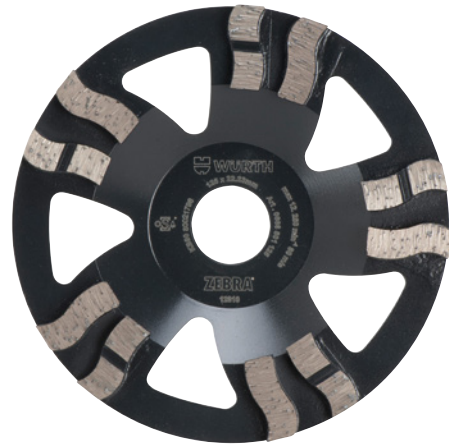
Solo a fini illustrativi

Per levigare quasi tutti i tipi di materiali in cemento e pietra