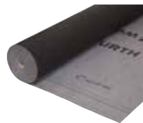
Wütop® 200 membrana traspirante Art. 0681 001 200

Nastro di colore nero ad alto potere adesivo, versatile nell'impiego, per incollaggi a tenuta ermetica