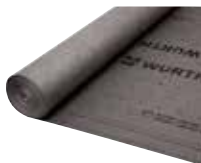
Wütop® 150 TR2 telo traspirante Art. 0681 001 092