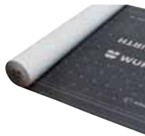
Wütop® 170 telo traspirante Art. 0681 001 016