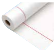
Wütop® DB2 barriera regola vapore Art. 0681 000 004