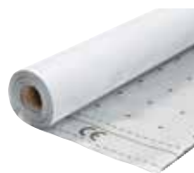
Wütop® DS 100 barriera al vapore Art. 0681 000 006