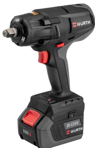
Solo a fini illustrativi