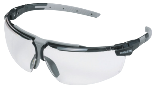
Afbeelding kan afwijken