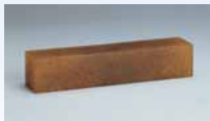
Čistič brúsnych pásov Obj.č. 893 01