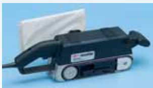
Ručná pásová brúska HBS 533 Obj.č. 702 588 1