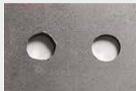
Veľmi presná kruhovitosť otvorov